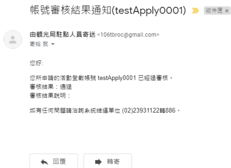
圖5. 帳號審核結果通知