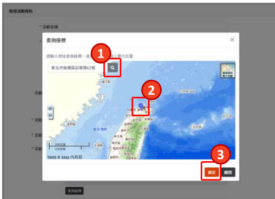
圖10. 新增活動資料—查詢座標