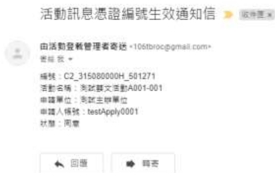
圖13. 審核完成通知信