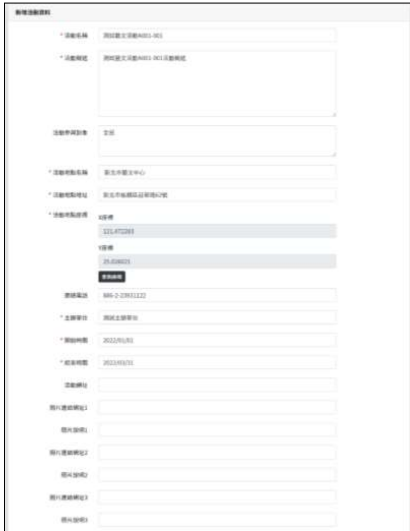
圖9. 新增活動資料—依照欄位填寫資料